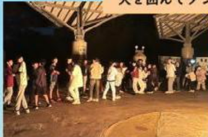
みんなで暖をとるのもいいね